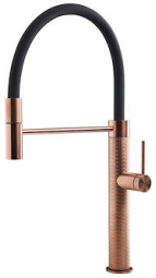
Monomando Skin Copper