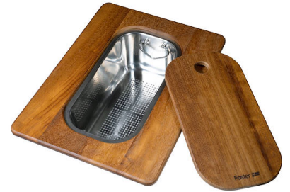
Tabla de corte Twin de madera Iroko con escurre pasta en acero inoxidable 8644 044