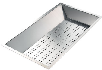
Bandeja perforada inox 8151 000 * sólo en combinación con el accesorio 8644 101