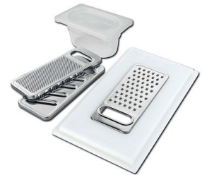
Kit rallador con soporte para anillo y bandeja de recogida de alimentos 8159 101 * sólo en combinación con el accesorio 8644 101